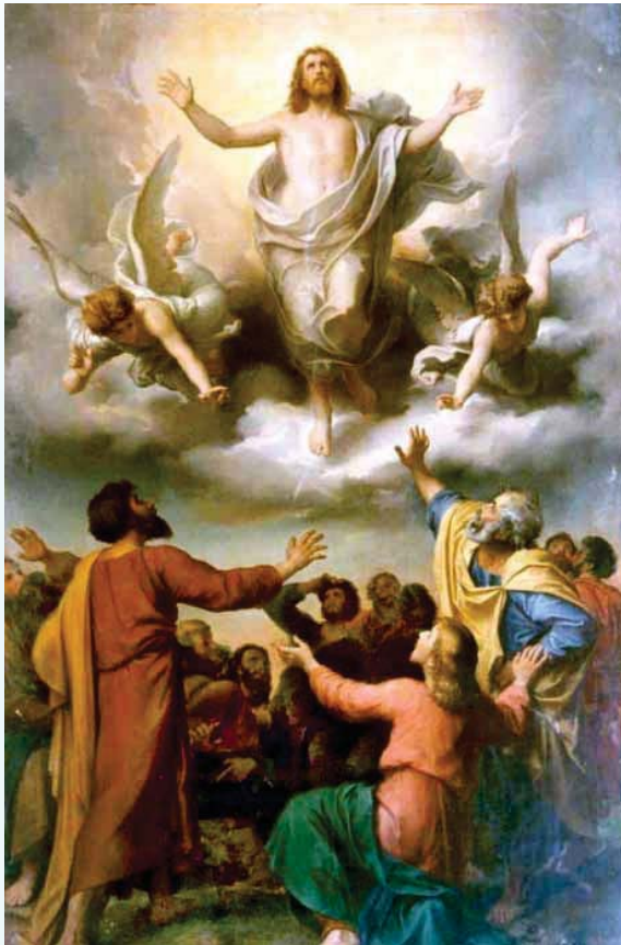
สมโภชพระเยซูเสด็จขึ้นสวรรค์

ปีที่ 24 ฉบับที่ 1213 วันอาทิตย์ที่ 13 พฤษภาคม 2561/2018